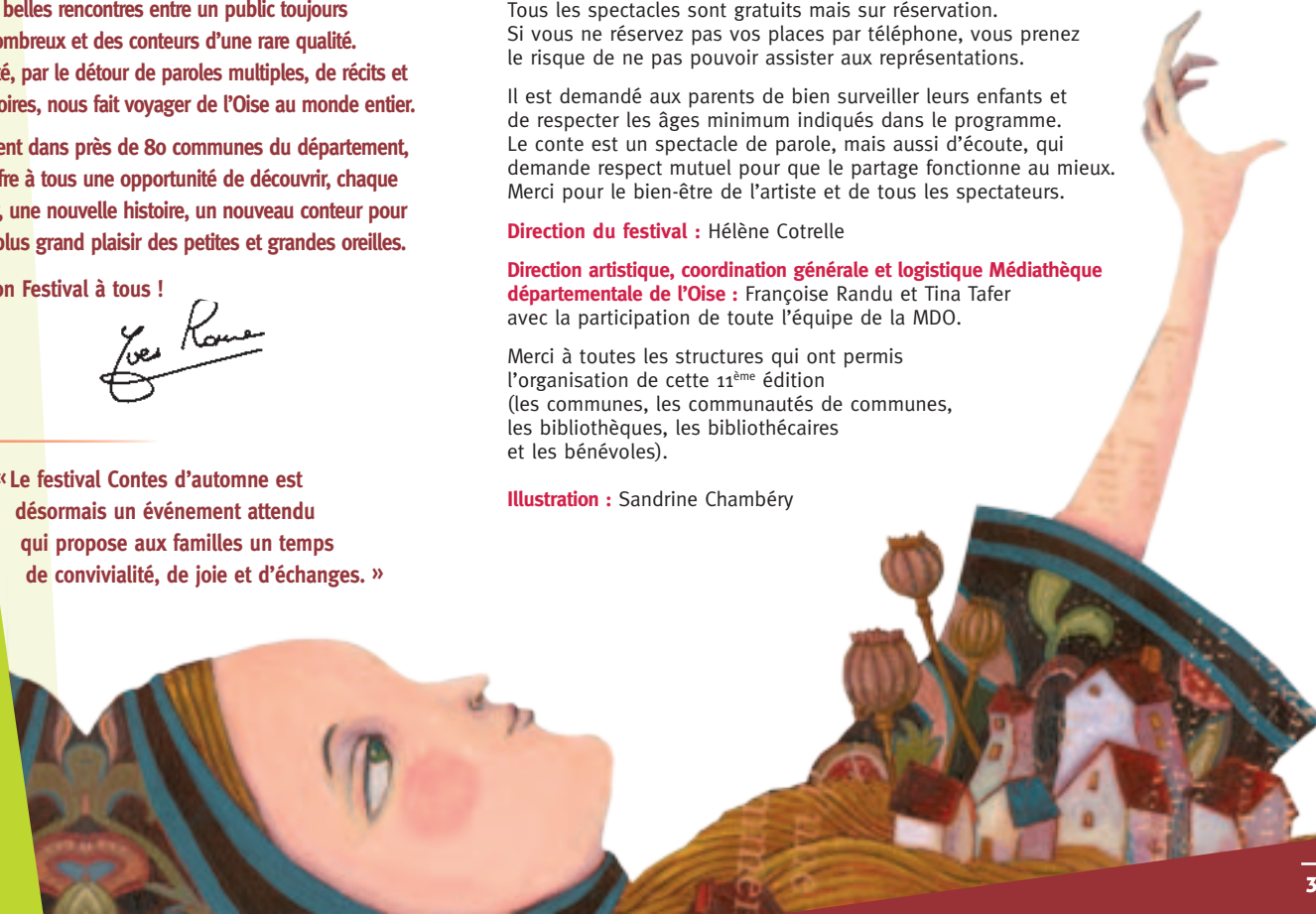
Illustration : Sandrine Chambéry

Merci à toutes les structures qui ont permis l'organisation de cette 11 ème édition (les communes, les communautés de communes, les bibliothèques, les bibliothécaires et les bénévoles).