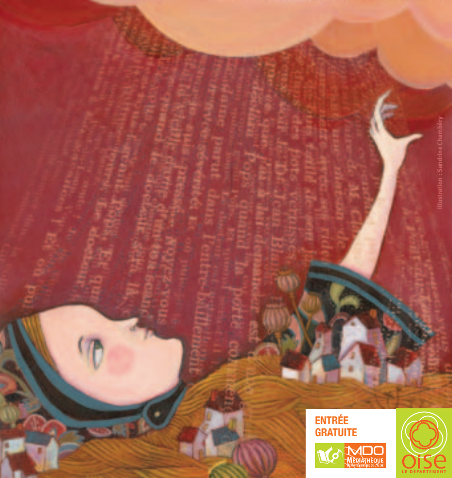
Illustration : Sandrine Chambéry