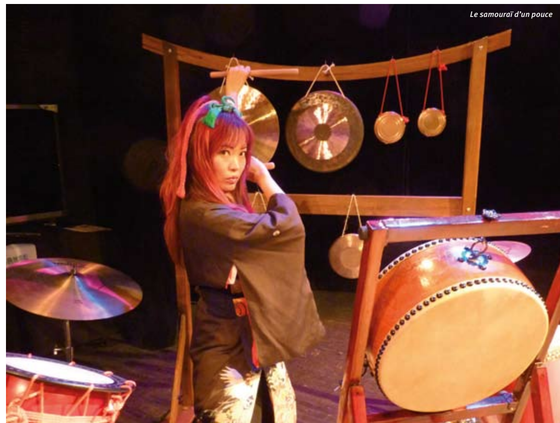
Le samouraï d'un pouce