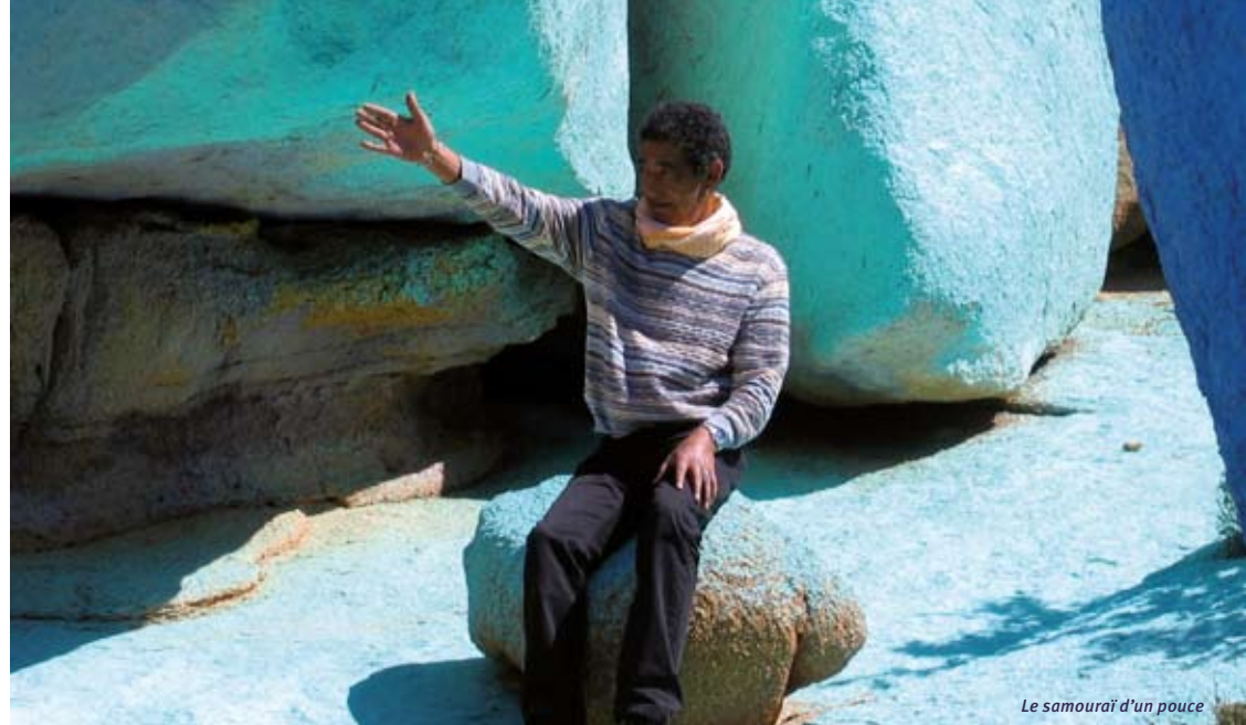
Le samouraï d'un pouce